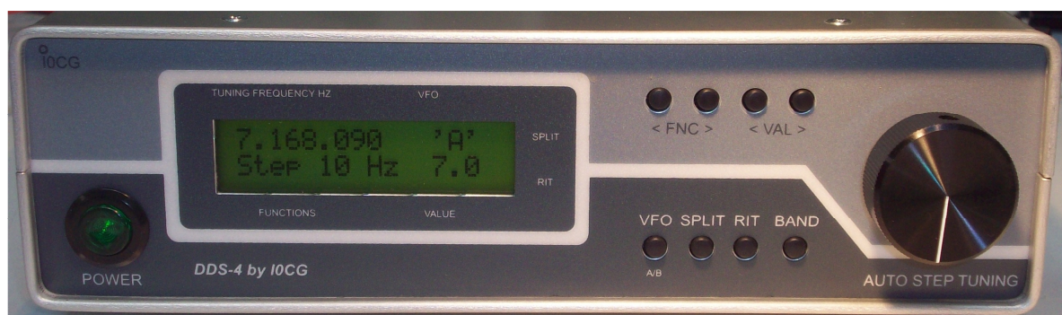
Pannello frontale della versione con contenitore in alluminio (versione B)

ATTENZIONE: per la prima installazione del DDS-4 leggere le NOTE DI PRIMA INSTALLAZIONE presenti a pag. 11 di questo documento